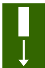
Plaats van een nooduitgang