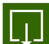
Uitgang of richting van uitgang