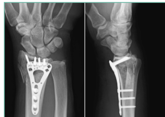
plaat en schroeven

Soms zal men kiezen voor een plaatje, dat meestal aan de ventrale zijde van het bot geplaatst worden en gefixeerd wordt op het bot met schroeven. Dit vergt veelal een kortere gipsimmobilisatie en het plaatje moet maar zelden verwijderd worden.