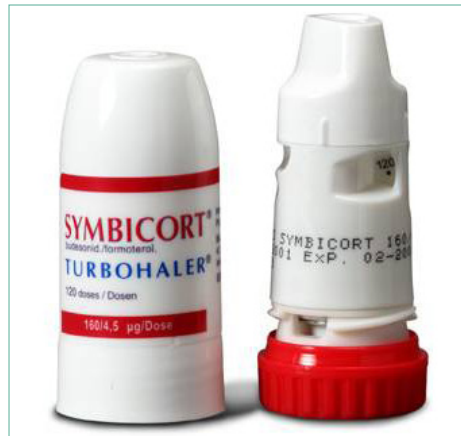
Bijvoorbeeld: Bricanyl, Pulmicort, Symbicort, ...