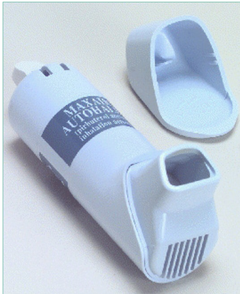
Bijvoorbeeld: Qvar, Airomir, ...